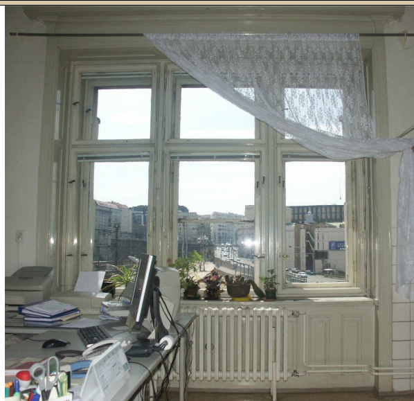
okno – celkový pohled z interiéru na vnitřní stranu