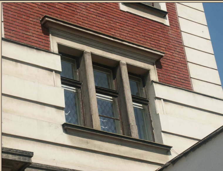
okno – celkový pohled z exteriéru na vnější stranu

repasovat, ponechat na původním místě, zachovat kličky, závěsy, zasklení (je-li historické), obnovit původní barevnost oken, bude-li zjištěna, nebo provést nátěr smetanovou barvou, bude-li restaurátorským průzkumem zjištěna existence krycího nátěru kamenných pilířků, tento obnovit Obnovit původní barevnost podle průzkumu barevnosti oken. Z interiéru obnovit bílý nátěr, z exteriéru obnovit povrchovou úpravu, shodnou jako u již rekonstruované části C. Viz technologický postup TP/118.